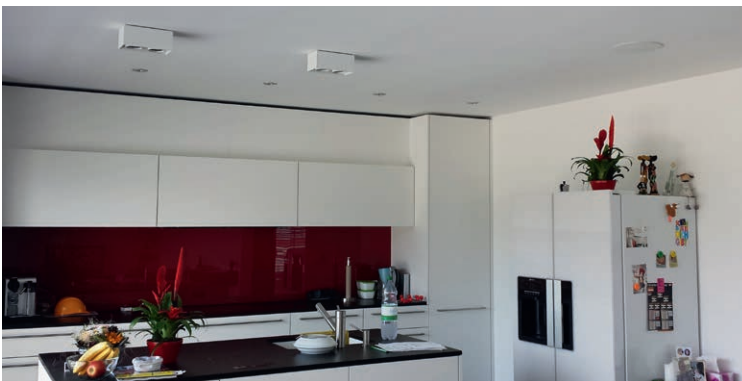
Wo sind die Lautsprecher? Dank Deckeneinbau kann man auch in Küchen oder Räumen eine saubere Background-Audio-Lösung realisieren.

Metz ist ein Fabrikat, das relativ wenige Fachhändler in der Schweiz verkaufen, ganz im Gegensatz zu Deutschland, wo Metz-Produkte im Fachhandel hohes Ansehen genießen und sehr gerne verkauft werden. Bei uns in der Schweiz klingt durch, Metz sei zu teuer. Unverständlich ist, warum nicht Argumente an erster Stelle stehen wie z.B. hohe Qualität, stabile Preise, erfreulich gute Marge, technische Anpassung über Jahre garantiert. Solche Pluspunkte hat Lutz erkannt, und seine Kunden profitieren davon.