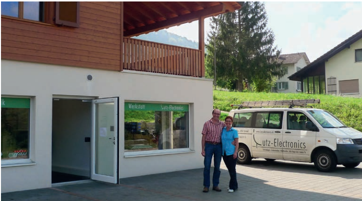
Vor vier Jahren bezog Lutz Electronics diesen schmucken Neubau, der zugleich Sitz des Unternehmens ist.